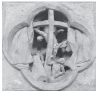
Dorn St. Peter, Osnabrück