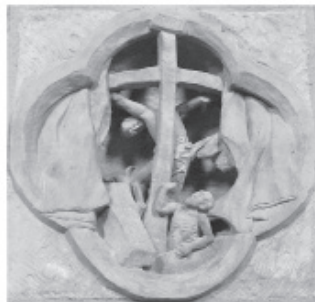
Dorn St. Peter, Osnabrück